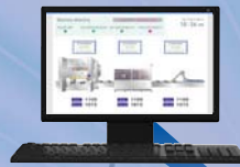
設備 4 資料收集電腦